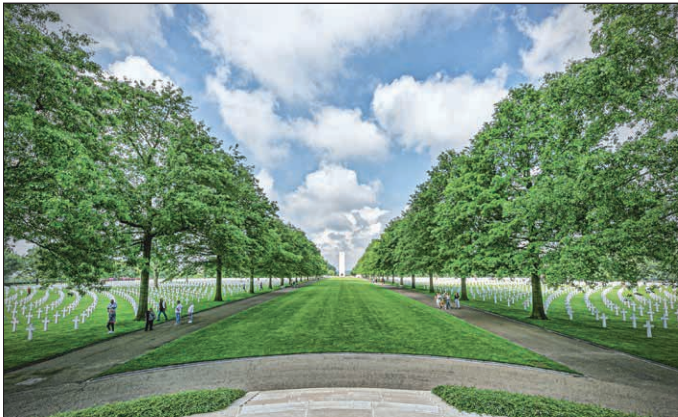
Soms zegt een beeld genoeg.